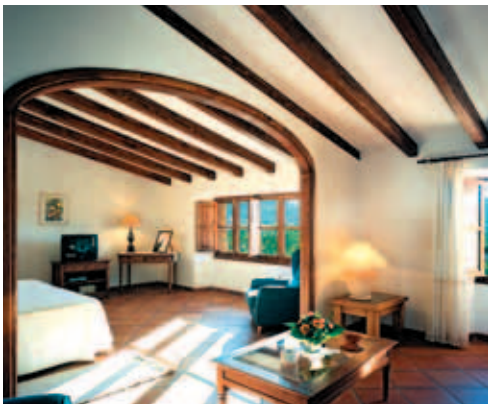
Alle Zimmer/Suiten im C'as Curial sind hier anders, aber alle großzügig mit angenehmer Wohnatmosphäre

☎ (0034) 971 632 494, Fax: (0034) 971 631 899, www.canai.com Junior Suite/ÜF ab €237, 1 Person €150; nicht billig, aber traumhaft