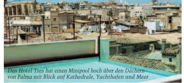
Das Hotel Tres hat einen Minipool hoch über den Dächern von Palma mit Blick auf Kathedrale, Yachthafen und Meer

Hotel Tres**** , ein typisches Designhotel (z.B. Air und Privatbucher, © 717333, Fax 717372, www.hoteltres.com ) liegt mitten in der Altstadt in der Restaurant- und Kneipengasse Apuntadors. In einem ehemaligen Palast mit schönem Patio und einem Anbau gibt es 41 Zimmer und Suiten in neuzzeitlich coolem Look aus viel Glas, Holz und kühlem Weiß. Die Bäder sind türlos mit den Zimmern verbunden. Auf dem Dach warten neben guter Aussicht Sonnenliegen, »Splashpool«, Sauna, Bar, zudem WiFi überall. Die coole Alternative; DZ/F ab ca. €220, EZ/F ab €160.