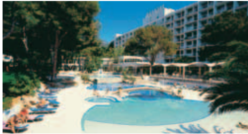
Prima Poolanlage des Eurotel in einem großen Park über einem kleinen Privatstrand mit Bootshafen

Eurotel Punta Rotja **** (z.B. TUI, DER, TC, Gulet, CB, Air, Jahn, Privatbucher, © 840380, Fax 840127; www.eurotelmallorca.com ). In Alleinlage an der Costa de Pins . Ministrand unterhalb des Hotelparks, Badefelsen und klares Wasser. Tennisplätze beim Hotel. Golf ganz nah. Spa, Wellness und Thalassotheorie. Sehr große Zimmer und Terrassen, die Meer und/ oder Wald überschauen. Tolle Pool- und Gartenanlage. Sonne bis zum Abend. Für 4 Sterne und das Ambiente in der Vor/Nachaison auch bei Privatbuchung günstig (dann UF möglich, Veranstalter bieten meist nur HP); DZ/UF ab €100, EZ/UF ab €80. Bei Katalogbuchung saisonabhängig kaum/ nicht teurer als in der **** Kategorie in Cala Millor (⇨ oben). Mit kleinen Kindern weniger geeignet.