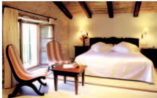
Zimmer in der Finca Monnaber Vell

DZ/ÜF €110-€159; Junior Suite ab €136; Suite ab €185; EZ=DZ €94-€124