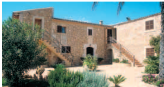
Haupt- haus der Finca Es Torrent

DZ/ÜF ab €100-€167, Junior Suite €123, Apartment €156-€263 (+7%)