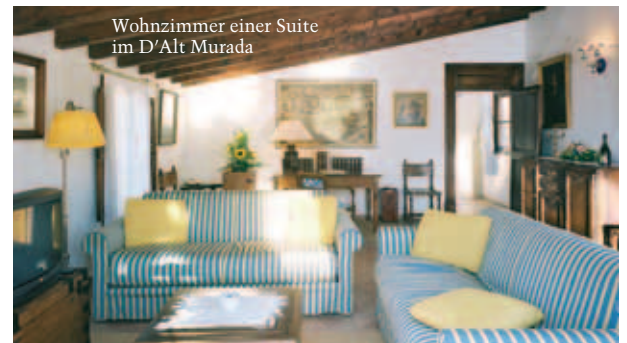
Wohnzimmer einer Suite im D'Alt Murada

Hotel D'Alt Murada**** , Carrer Almudaina 6A (TUI, Privatbucher, © 425300, Fax 719708, www.daltmurada.com ) ist ein wunderbarer Stadtpalast im ruhigen Altstadt-Fußgängerbereich zwischen Kathedrale und Zentrum. Originale und authentisch mallorquin-nostalgische Ausstattung (Gemälde, Möbel) verbunden mit modernem Komfort inkl. Internetzugang (Wifi). Ein kleiner Garten ist auch vorhanden. 3 DZ und 5 Suiten. DZ/ÜF ab €149, Suite/ÜF ab €255 plus 7% MWSt.