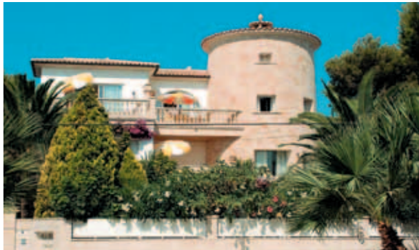
Individuelles Edelquartier Villa Piccola

Die Villa Piccola **** mit »Edel«-Apartments in konservativer Eleganz (Privatbucher ☎ 655393, Fax 656033, www.villapiccola.com ) liegt nur 100 m entfernt vom Sandstrand Es Trenc . Das Haus »versteckt« sich in einem hübschen Palmengarten mit Pool. Die Suiten bzw. Apartments sind groß und komfortabel und haben Balkons bzw. Terrassen. Viel Infrastruktur befindet sich in kurzer Distanz in der Umgebung. Kosmetik-Behandlungen und Massagen können im Haus gebucht werden. Für jeweils 2 Personen kosten die Suiten/Apartments ab ca. €82-€255/Tag inkl. Frühstück und aller Nebenkosten je nach Saison. Etwas mehr bei 3 oder 4 Personen in den größeren Einheiten. Langzeit-Winterpreise auf Anfrage. Keine Vermietung unter 4 Tagen.