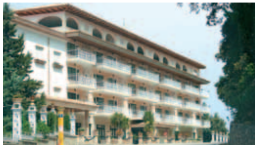
Hotel El Encinar: Balkons zur nachts ruhigen Straße und ebenso zum Meer hin. Großer Pool links im Wald

Apartmenthotel El Encinar**** (z.B. DER, N, CB, Privatbucher © 612000, Fax 616019) auf halbem Wege nach Valldemossa unmittelbar an der Küstenstraße in Alleinlage hoch über der Küste. Großer Pool, Tennis- und Kinderspielplatz. Aussichtsterrassen, von denen der Blick weit übers Meer fällt. Nur 2-Zimmer-Apartments zu je 60 m 2 mit zwei Terrassen zu Straße/Wald hin und zur Meerseite. Oben aufgestockte Hotelzimmer (EZ=DZ) mit großer Terrasse zur Meerseite.