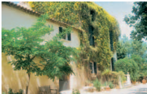
Hinter dieser romantischen Fassade verbirgt sich das Hotel Son Pons mit Design-Räumlichkeiten vom Feinsten

Tarife identisch Albellons ; HP in beiden plus €27/Person (4 Gänge)