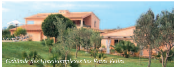
Gebäude des Hotelkomplexes Ses Rotes Velles

DZ/ÜF ab €115, größere DZ/ÜF especial €130, EZ/ÜF ab €73