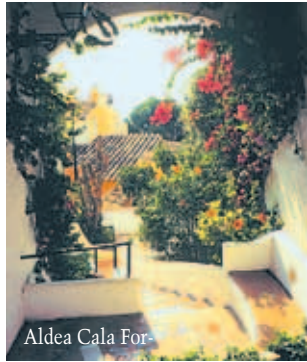
Aldea Cala For

Ponent*** (TUI) ist ein ansprechendes, mittelgroßes Apartmenthaus direkt an der Platja Grande . Geräumige Wohneinheiten mit großer Terrasse. Sonnengünstige Ausrichtung, Tagsüber rundherum viel Betrieb, aber ab spätem Nachmittag und nachts ruhig. Ideal mit Kindern, die gefahrlos allein zum Strand laufen können.