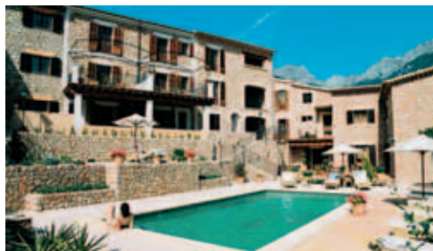
Blick auf Pool und Haupthaus von Sa Tanqueta in Fornalutx

Apartment mit Frühstück 1 SZ ab €130; Apartment 2 SZ ab €190