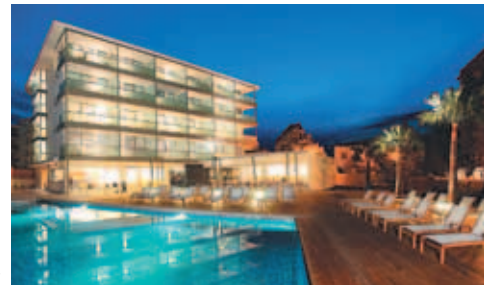
Das kleine (43 Zimmer) Designhotel Aimia ist das erste »echte« ****Haus in Port de Sóller

Hotel Suliari Palace ***(*) (z.B. N, CB, Jahn, DER, TUI), ein renoviertes Hotel in etwas ungünstiger rückwärtiger Lage am Berg. Aber im Rahmen des lokalen Hotelangebots gute Zimmerqualität; in dieser Hinsicht besser als andere und preiswerter.