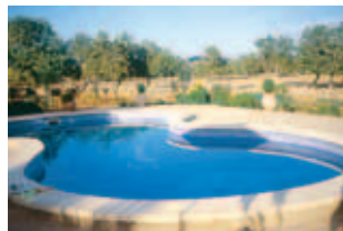
Pool von Na Set Centes

Die kleine Finca Na Set Centes liegt östlich von Arta in Alleinlage mitten zwischen Feldern, Weiden, Mandel-, Feigen und Johannisbrotbäumen und einem Steineichenwäldchen. Das ca. 200 Jahre alte Bauernhaus wurde behutsam restauriert, ohne aus den alten Elementen Luxus entstehen zu lassen. Die 3 DZ und 1 Suite bieten modernen Komfort, sind aber nostalgisch rustikal möbliert. Um das Haus herum spielt sich noch echte Landwirtschaft ab. Die Gastgeber sind ältere Mallorquiner, die auch das Frühstück selbst bereiten. Ein kleiner Pool wurde für die Gäste ins Gelände integriert.