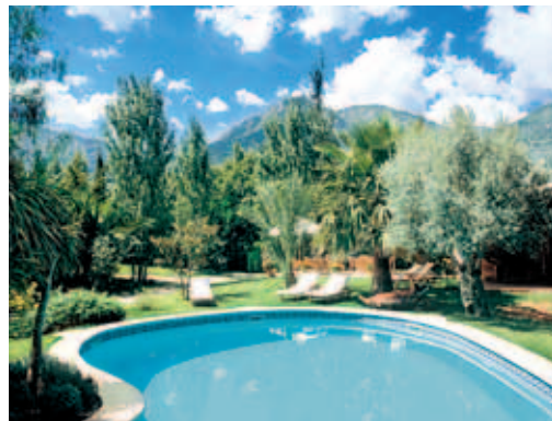
Pool und Aussicht auf die Berge im Garten von Can Quatre

DZ/ÜF €159; Junior Suite €189; Suite €215; Winter minus 15%