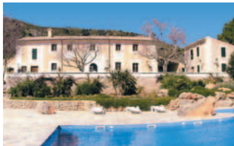
Haupthaus und ein Bungalow (mit zwei Apartments) der Finca Son Siurana

☎ (0034) 971 549662, Fax (0034) 971 549788, www.sonsiurana.com «Haus» für 2 ab €122, Aptm. für 4 Pers. ab €196, Suite ab €110 + 7%; alles ohne Verpflegung. Frühstück zusätzlich €12 pro Person.