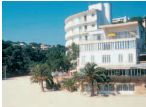
Hotel Cala Santanyi (siehe rechts) und das dahinterliegende Apartmentgebäude. Das Restaurant des Hotels liegt unmittelbar über dem, das Café direkt am Strand

Gute 4 km westlich befindet sich an der Cala Mondragó das einfache ** Hotel Playa Mondragó (CB; © 645303, www.hotelplayamondrago.com ) gleich hinter der Bucht, ⇔ Seite 76 des Reiseführers. In den Sommermonaten ist diese Lage absolut Spitze, das Haus nicht schlecht relativ zum Preisniveau, in der Vor- und Nachsaison vielleicht ein wenig zu weit ab vom Schuss. DZ/ÜF €60-€80; EZ/ÜF €40-€60.