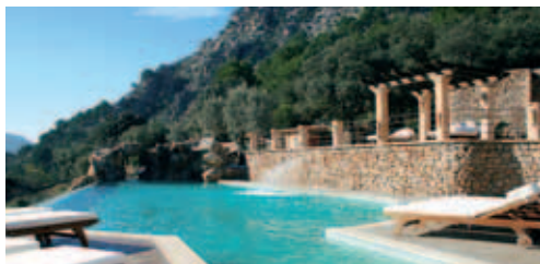
Von einer Quelle gespeister Pool des Es Ratxo am Fuß des Galatzo

DZ/ÜF €195-€415; EZ ab €195, Juniorsuiten ab €385, Suite ab €595