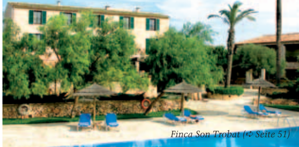
Finca Son Trobat (↔ Seite 51)