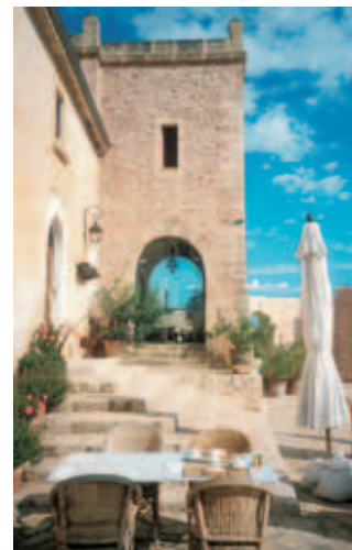
Terrasse Amoixa Vell und Eingang