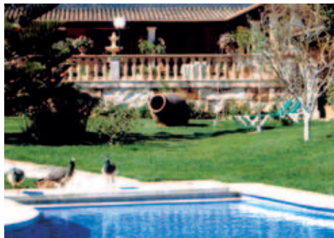
Im Poolgarten der Finca Posada d'Aumallia; im Hintergrund die sonnige Terrasse mit schattiger Überdachung