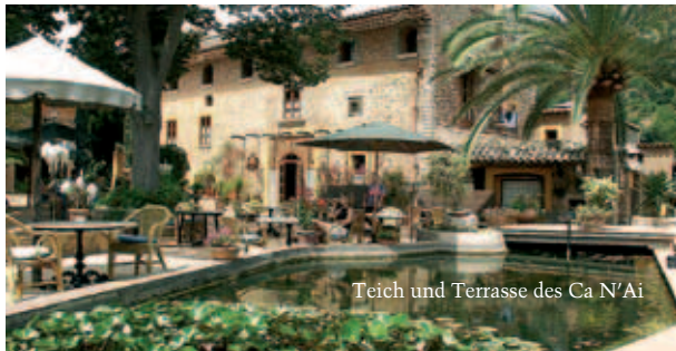
Teich und Terrasse des Ca N'Ai

Das früher öffentliche, sehr gemütliche mit einem wintergartenähnlichen Salon verbundene Restaurant auf unterschiedlichen Ebenen steht heute allein den Gästen des Hauses zur Verfügung, die à la carte zu Preisen der gastronomischen Mittelklasse hervorragend bedient werden. Die Logik des Chefs ist hier: »wir wollen möglichst viele Gäste im Haus behalten, wenn wir schon das Restaurant haben, und sie nicht an die Lokale des nahen Umfelds verlieren«. Im Sommer wird draußen auf dem Hof unter Bäumen neben einem Teich gefrühstückt und diniert. Der Blick fällt dabei aus etwas erhöhter Position über die 5000-Bäume-Orangenplantage. Mittendrin befindet sich der Pool. Die hochgeschnittenen alten Bäume sorgen rundherum idyllisch für Schatten. Ein Spa- und Wellnessbereich ist in den Hallen einer alten Pumpstation im Bau. Die Besitzung Ca N'Ai grenzt unten an die Straße nach Port de Sóller und die Straßenbahn (dazwischen liegt ein hoher Wall). Man kann dort direkt in die Bahn in beide Richtungen einsteigen.