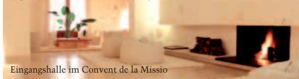
Eingangshalle im Convent de la Missio

Hotel Convent de la Missio**** , Carrer de la Missio 7A (Air, DER, TC, Privatbucher, © 227347, Fax ... 348, www.conventdelamissio.com ) entstand aus einem früheren Priesterseminar unweit der Rambla und der Einkaufsstraße Sant Miquel. Nur 14 stilistisch gekonnt gestaltete Zimmer mit allem Komfort, in denen Weiß dominiert. Innenhof, Dachterrasse mit »Wasserfall«, japanischer Garten; viel Kunst (Gemälde, Skulpturen, Objekte) an den Wänden in eigener Galerie und im Restaurant »Refectori«, einem schönen Beispiel für die Kombination von Modern Design und historischem Ambiente. »Mini-Spa« (Sauna-Jacuzzi) und Garage. DZ/ÜF ab ca. €230 inkl. MWSt.