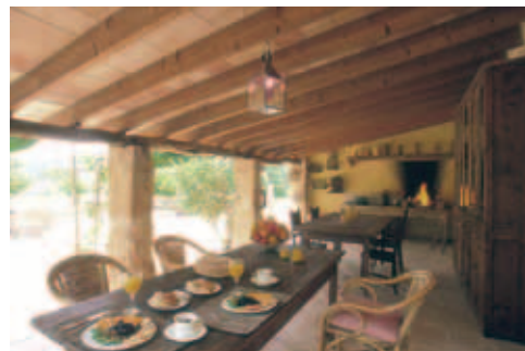
Terrasse mit offenem Kamin auf der Finca Binicomprat

☎ (0034) 971 125 028, Fax: (0034) 971 665 773, www.fincabincomprat.com ; DZ/Apartment/Ü ab €126/147 (App. bis 4 Pers.) + MWSt.