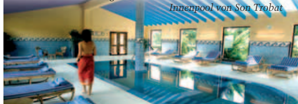
Innenpool von Son Trobat