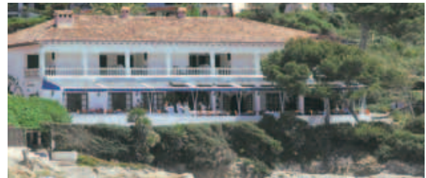
Cap Vermell Beach Hotel

Das Cap Vermell Beach Hotel Vintage 1934 *** (faktisch ein kleines Mittelklasse-Hotel, nur Privatbuchungen, © 841157, Fax 841161; www.cap-vermell-beachhotel.com ). Nostalgisches Haus mit 12 altmodischen Zimmern und wunderbaren Terrassen (Restaurant) einige Meter über dem Strand von Canyamel. An der Ostküste einer der schönsten Plätze für Individualisten. Infrastruktur von Canyamel in Fußgängerentfernung (Tenniscenter); der Golfplatz Canyamel liegt »um die Ecke«. DZ/ÜF kostet ab €94-110, EZ/ÜF ab €60.